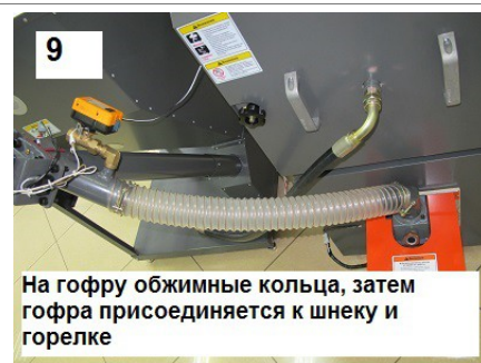
9 На гофру обжимные кольца, затем гофра присоединяется к шнеку и горелке