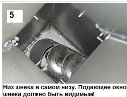
5 Низ шнека в самом низу. Подающее окно шнека должно быть видимым!