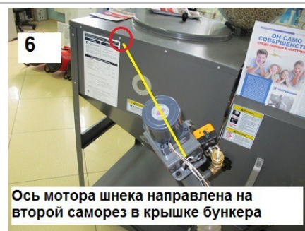
6 Ось мотора шнека направлена на второй саморез в крышке бункера