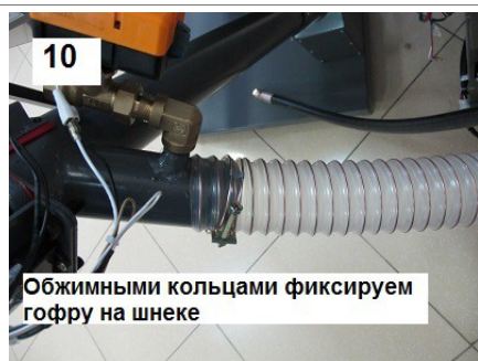
10 Обжимными кольцами фиксируем гофру на шнеке