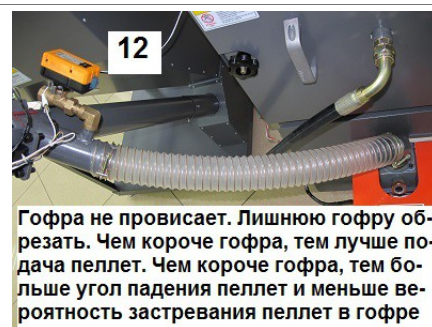
12 Гофра не провисает. Лишнюю гофру обрезать. Чем короче гофра, тем лучше подача пеллет. Чем короче гофра, тем больше угол падения пеллет и меньше вероятность застревания пеллет в гофре