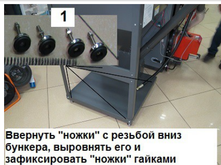
1 Ввернуть "ножки" с резьбой вниз бункера, выровнять его и зафиксировать "ножки" гайками