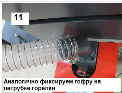
11 Аналогично фиксируем гофру на патрубке горелки