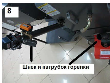
8 Шнек и патрубок горелки